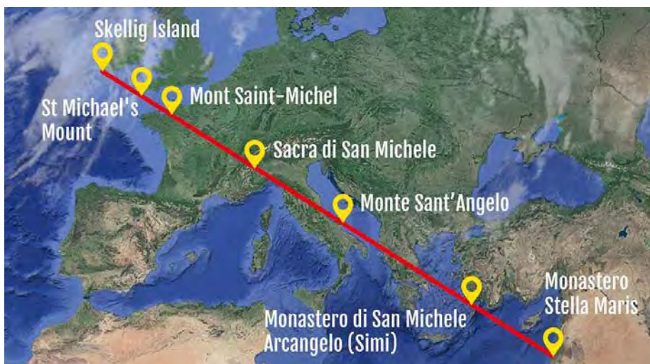
La ligne de l'épée de saint Michel reliant les sanctuaires dédiés à l'Archange.

Après cette introduction, nous vous présenterons, dans les prochains numéros, quelques sanctuaires dédiés à saint Michel.