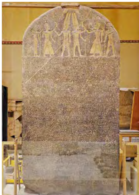
La stèle de Mérenptah mentionne Israël comme groupe ou entité en Canaan.

« Quelle que soit l'approche adoptée, le cœur du récit demeure sa signification religieuse et symbolique : il s'agit d'affirmer que la liberté est un don divin et qu'elle exige confiance, mémoire et engagement. »