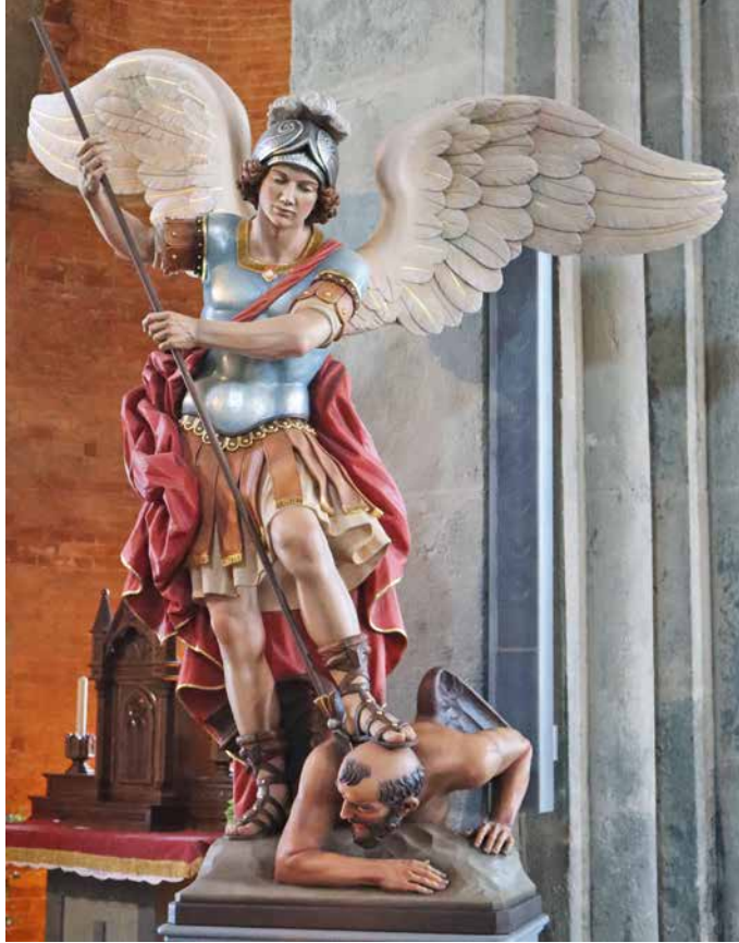
Saint Michel terrassant Satan/Sacra San Michele della Chiusa.