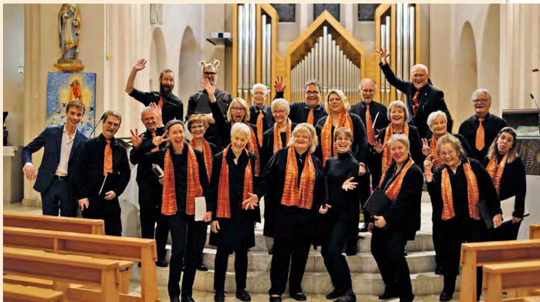
Un chœur en joie.

Les chœurs vont à la rencontre de la population. Chanteurs et public seront mélangés sur la place du village pour la création de la messe du « Bon Pasteur » commandée spécialement pour l'occasion à Valentin Villard.