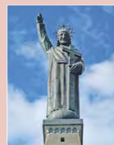
Vers le Christ-Roi de Lens.

Ce pèlerinage s'effectue sans inscription. Bienvenue à tous les pères de famille!