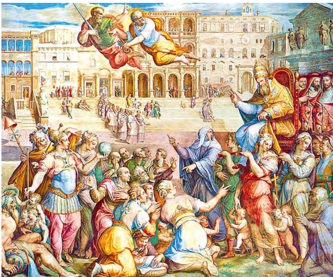
Catherine de Sienne s'est immiscée dans la politique ecclésiastique et a changé le cours de l'histoire.

Catherine mourut à Rome le 29 avril 1380, fut canonisée en 1461 et nommée sainte patronne de l'Europe en 1999. Sa fête est célébrée le 29 avril.