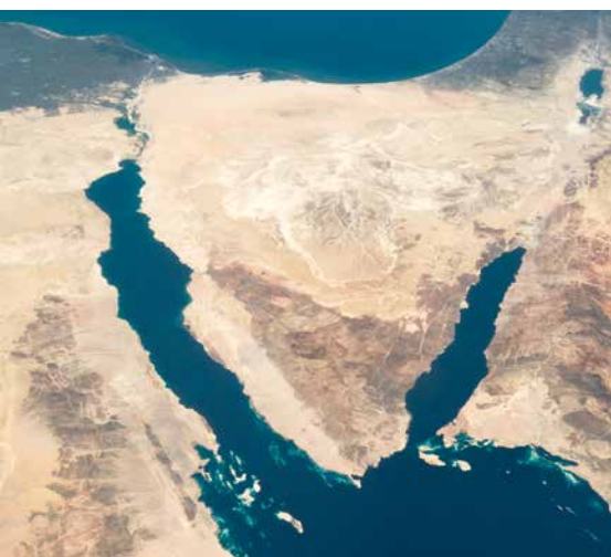
Les fouilles dans la péninsule du Sinaï n'ont pas mis au jour des vestiges attribuables à un grand groupe d'exilés.

« Quelle que soit l'approche adoptée, le cœur du récit demeure sa signification religieuse et symbolique : il s'agit d'affirmer que la liberté est un don divin et qu'elle exige confiance, mémoire et engagement. »