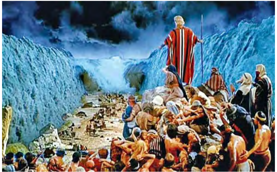
Moïse séparant les eaux, vu par Hollywood, fait appel à la puissance divine et non à un phénomène naturel.

Le passage de la mer Rouge par Moïse constitue l'un des épisodes les plus emblématiques de l'Ancien Testament. Rapporté principalement dans le livre de l'Exode, cet événement marque l'aboutissement de la libération du peuple hébreu, réduit en esclavage en Egypte depuis plusieurs générations.