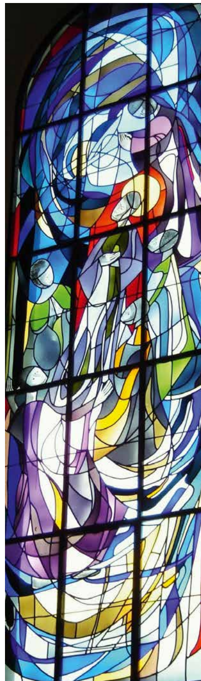
Bramois, sainte Thérèse de Lisieux

Ses parents, Louis et Zélie Martin, seront canonisés en 2025.