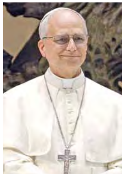
Pie XII, François ou Léon XIV ont chacun éclairé à leur manière ce passage biblique.